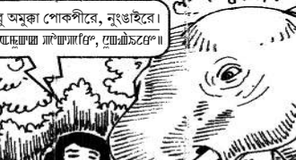
শামুনা মাচবু কোনুন্দা পুৰুপুগী।