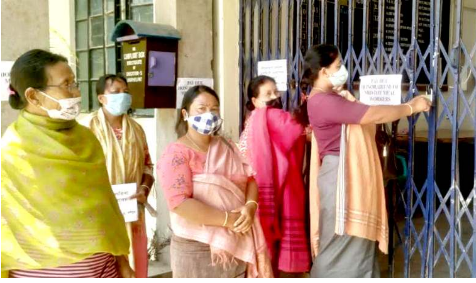
মি-দে বাৰ্কৰ ৯,৬০০ লোমগী থা ৯ গী ওনয়িম মণিপুৰ লৈওজনা লৈবনী মায়োজা ওসি মি-দে মিল বাৰ্কৰস যুনিয়ন মণিপুৰগী যোঁমিাংনা লফোংপাতা লৈবা দিৰেভোৰেট ওফ এদুকেশন (এস) কী ওফিস সো লোনশিনবিবা

টিড ওইহি অমসং লায়না অসিনা মীওই ১৪ গী পুলি লোমহনবি। কামৰূপ (মেট্ৰো) না পোজিটিভ কেস মশীং স্বাইদনী য়ান্না থেংনবি। হেল্থ মিনিষ্টৰনা পালাসবাৰিদা লৈবা সন ফাৰ্মাদা লাইভ প্লাস্টদা চতুনা কোভিড-১৯ লায়ংদা শীজিমাৰিবা ৰেমেদেসিভিৰ ইঞ্জেন্সন শাবনী থবক য়েংনবি। প্লাস্ট অদুনা চয়োল অমদা ইঞ্জেন্সন ভাইল ৮০,০০০ পুথোকপা ওশী।