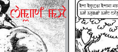
ইহা ইংভেজা ইপানা নাচবু অমুক্ক পোকপাৰে, নুঙহিৱে।