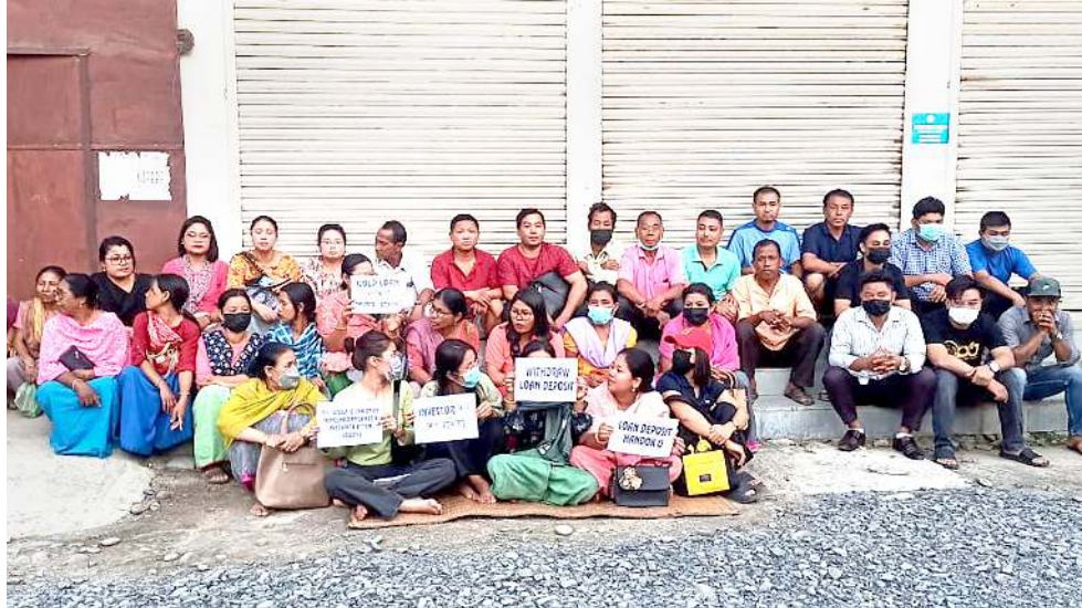
এন কে নিখি লিমিটেড ককচিং ব্রাঞ্চনা মীয়ামদগী যান্না শেনফম খোমগংখ্রা তুমিমা লৈখিবগী থৌওংবু যান্নিওদবা ফোঙদোকখিবা মীফম

থৌদোক অসিদা লৈখিবদা মশাগী থা ১৮ খজ লাইরিবা অঙাং অসিগী মমানা ময়ম মনাজ লৈবা অশুকপা মফমশিং শেংদক্লিঙেদা খঙহৌদনা লঙ্গী শামুশিং অদু লাকখিবনি। শামু অদুনা অঙাং অমদি মমা তল্লা চেনশিল্লকখি। অদুব মমা অদুনা মচাব পমখতুনা চেমবা হোংনবদা গুমখিদে। অঙাং অদুব শামুগী মখোঙনা নেংপনা হানখিবদগী খুদজ থৌদোক থোকফমদা লৈখিবনি। শামু মনাতোলা শাফু ককা থারকপদগী মমাদুসু অরুবা ফিতমদা শোকপদগী হোস্তিটালদা লায়করি।