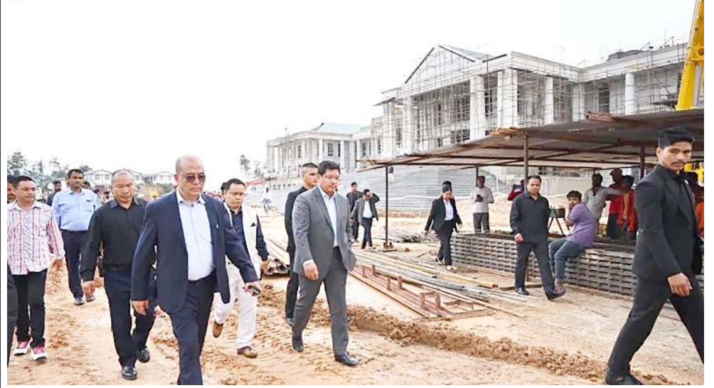
ন্যু শিল্লোংদা শাবিবা এসেমব্লি বিল্ডিংগী মথক থংবা শরুক নীংখায়খিবাগী যৌদোক অদু চীফ মিনিষ্টর কোনরাদ সংমানা হকথেননা চতুনা য়েংশিনখিবা

পীশিন্দনা হায়জগ্রে। টেট অসিদা দোনয়ি হায়বগী ৱাহহোলা নুমিং হায়বনি অদুগা পোলোগী ৱাহহোলা থা হায়বনি। নুমিং অমসুং থাগী মমিং লৌরগা গ্রিনফিল্ড এয়রপোর্টকী মমিং অসি দোনয়ি পোলো এয়রপোর্ট ওইনা খোলাহা যুনিয়ন মিনিষ্টরদা হায়জখিবা। লাক্সিবা ওগষ্ট ১৫ ইন্ডিপেন্ডেন্স দে নুমিতা এয়রপোর্ট অসি শেম শাবগী থবক লোয়শিবা পান্দম থল্লি। এয়রপোর্ট অসিগী পাক চাওবনা হেপ্টর ০২০ নি।