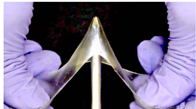
চিংখোক য়াবা গ্লাসি জেল

চিংখোক-চিংশিন য়াবা পোলিমৰ ওইৱকই। গ্লাসি জেলশিংনা সোলভেট অদুনা পোলিমৰগী মৌলিকুলৱ চেইনশিংসি ইছোৱকই অদুগা অহোংবা অমসুং