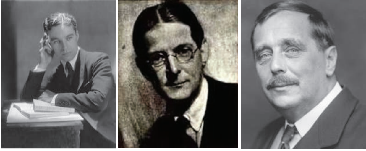
Charlie in 1921