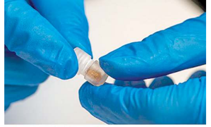
জি আই ব্রেট্টকী বেষ্টিরিয়াশিংবু খোমজিনবা গুমা কেপসুল

খিরিলগী মহীদু চুপশিল্লকই। অসুয়া সেন্সপলিং তৌবা লৌইরবা মতুংনা প্ৰেসরনা কেপসুলদুগী এপৱচরবু খুমজিল্লি।