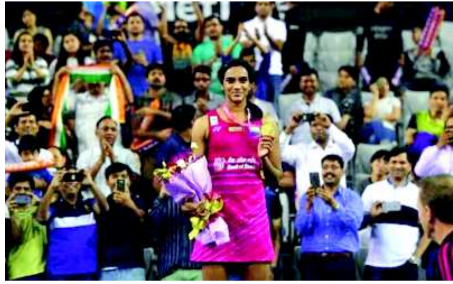
চোংখংতুনা অনীশুবা পোজিসন্দা লৈবা গু মখিবনি। পদ্ম ভূষন এৱাৰ্দকীদমক পি ভি সিন্ধুবু ৱিক্ৰেমেণ্ট তৌখে হায়বসু স্পোর্টস মিনিষ্ট্ৰিগী ওফিসিএল অমনা কনফাৰ্ম তৌখে। অম্ৰোমদা, পদ্ম ভূষন এৱাৰ্দকীদমক নোমিনেট তৌখিবা অসিগীদমক

বি সী সী আইগী মায়ক্ৰেদী এম এস থোনিবু পদ্ম ভূষন এৱাৰ্দকীদমক নোমিনেট তৌখোৱা মতুংদা অনীশুবা ইন্দিয়ন এথলেট ওইনা গুসি সিন্ধু স্পোর্টস মিনিষ্ট্ৰিনা নোমিনেট তৌখিবনি হায়ৰি।