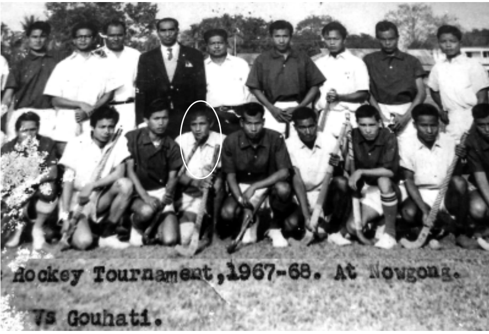
Hockey Tournament, 1967-68. At Nowgong. Vs Guwahati.