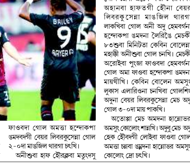
অলাৱিওনা গোল অমা অমুক চখি। গোলাশিং অদু হুন্দোৱক্কী বগীদমক হেমবৰ্গকী শান্নবোয়শিংনা কমা হোংনখি। অদুৱ অহানবা হাফ লেইবা

বৰ্লিন, সেপ্টেম্বৰ ২৫ (এজেলি) : বুন্দেজলিগা ফুটবোল লীগকী গুসি শান্নবিবা তৰুক শুব বাউন্দগী মেচশিংদা বেয়ৰ লিবৰকুসেন্না হেমবৰ্গ মায়থীবা পীখে। অদুগা অতোপ্লা মেচ অমনা হান্নোভৰ অমসু কোলোং গোল চ্ৰাদনা দ্ৰো হেঙে।