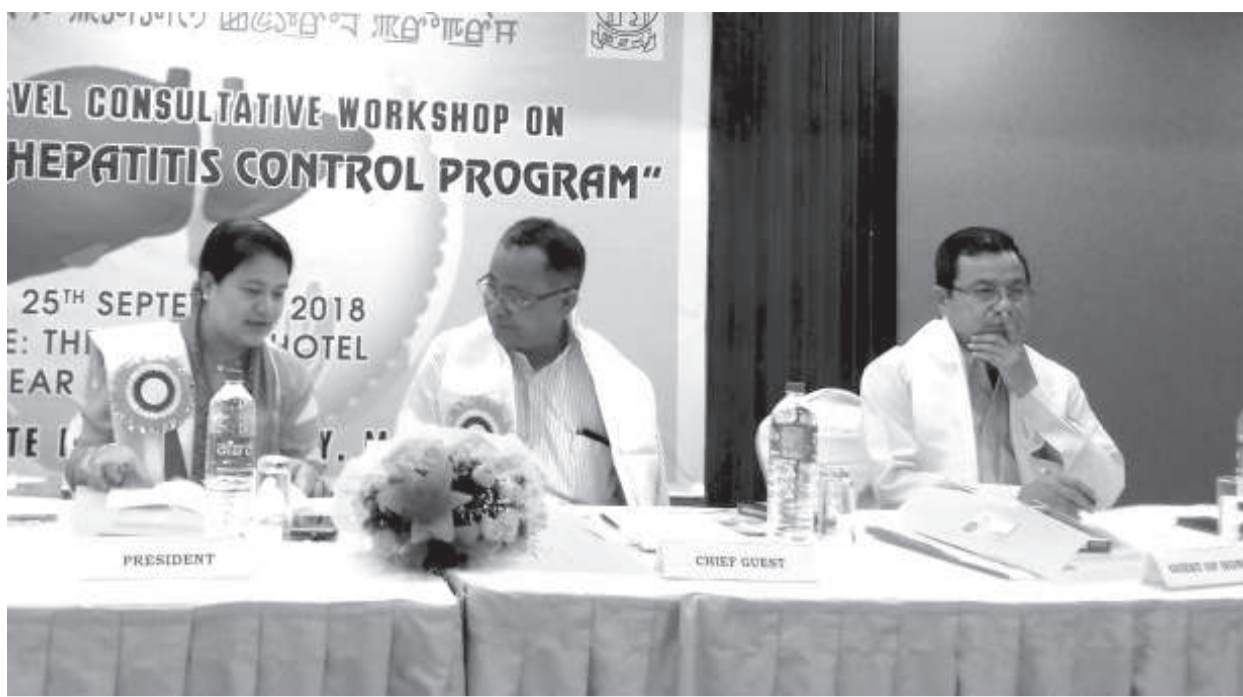
নেসনল হেল্প মিসন মণিপুৰ অমদি দিৰেক্টোৱেট এফ হেল্প এন্ড ফেমিলি ৰেলফেৰ লভিসেনা শীনাৰা নেসনল ভাইৱেল হেপাটাইটিচ কন্ট্ৰোল প্ৰোগ্ৰাম হৌদোকপা

ট্ৰাণ্‌স্‌লেট/পূজা গোপিকনা কাৰগা চাবা থকপা যাদবা, চাবা তুদবা, পুকচিপে নাবা, থবাক নাবা, যৌনাওদা ইথলতা থনগলগা লৈৱাগা য়ান্না নুঙাইতবা, খোঙ খুং শজিং হৌৱাগা ইপং পংশিলগা শিথগে তোঁবা, খুঙউ নাবা, খোঙ হায়া যাদবা ফহনবগী ওজা জিয়া উল হগপু থাগচৱি