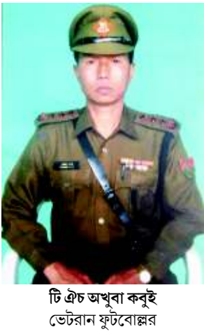
টি এচ অখুবা কবুই ডেটরান ফুটবোল্লর