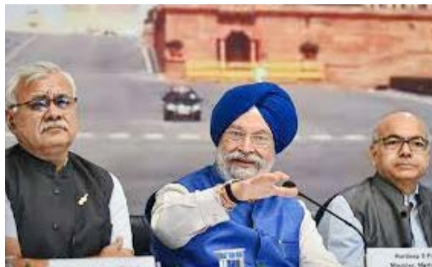
ফোৰাৰ ২২.৯.১৭ পীৰগা প্ৰজেক্ট অসিগী দিজাইন, কোষ্ট ইষ্টিমেশ্বন, লেণ্ডস্কেপ, ট্ৰাফিক ইন্টিগ্ৰেশ্বন প্লান্ট অমদি পাৰ্কিং ফেসিলিটিমচিংবগী মাষ্টৰ প্লান অমা শেমহল্লগনি। থোঁৱাং অসি লৌখংলকপদা প্ৰজেক্ট

গুজৰাটতা বেজ তৌবা এচ সি পি দিসাইন, প্লানিং এন্ড মেনেজমেণ্টনা পাৰ্লিয়ামেন্ট বিল্ডিং শাৰবগী থবক পায়খংকদৌৱি। এচ সি পিদা লুপা