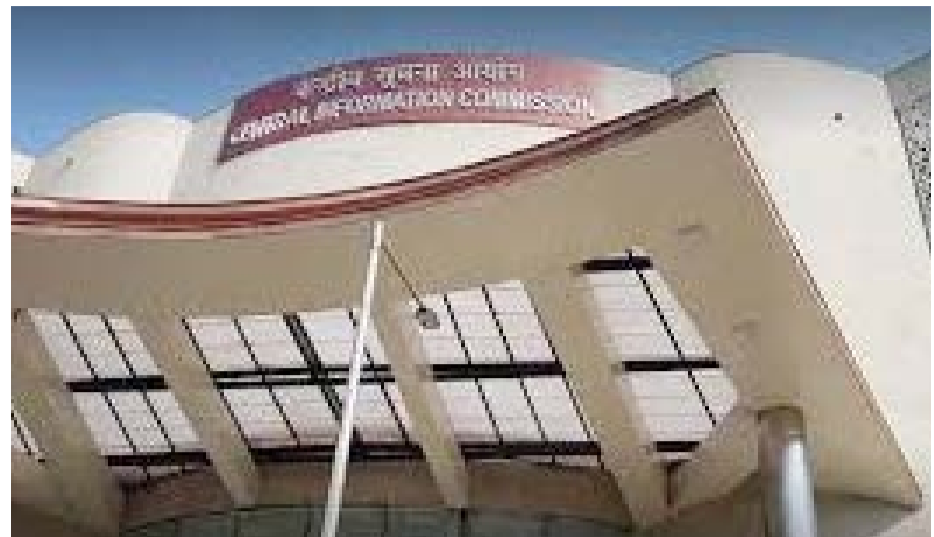
চীফ ইনফোৰ্মেশ্বন কন্মিষ্ট্ৰাৰগী তোলাপ লুপা লাখ ২.৫ নি। ইনফোৰ্মেশ্বন কন্মিষ্ট্ৰাৰগীনা লুপা লাখ ২.২৫ নি। সেন্টৰনা লৌখংলক্ৰিবা থৌৱাং অসিগী মাজোৱা তোঙান-তোঙানবা এক্টিভিষ্টশিংগী হায়থি মদুদি আৰ টি আইগী মৰী লেনবা থবক থৌৱম পায়খংপদা ষ্ঠাইনদগী অৰাংবা

অনৌবা ৰুল অসিগী মতুংইয়া কন্মিষ্ট্ৰাৰশিংগী থৌ পুগদবা মতম চহী তদা হস্থহল্লো। কুমজা ২০০৫গী এক্ট মতুং ইয়াদি কন্মিষ্ট্ৰাৰশিংগী থৌ পুগদবা মতম চহী ৫ নত্ৰগা মগাৰী চহী ৬৫ ফাওবা ওইহনখিবনি। এদমিনিষ্ট্ৰেশ্বনগী থাইনদগী সিনিয়ৰ ওইবা ওফিসাৰশিংগী মথং অকি অখঙ যাওনদা থবক লৌখংপা ওমহনবগী পান্দমদা থৌৱাং অসি পায়খংলগনি।