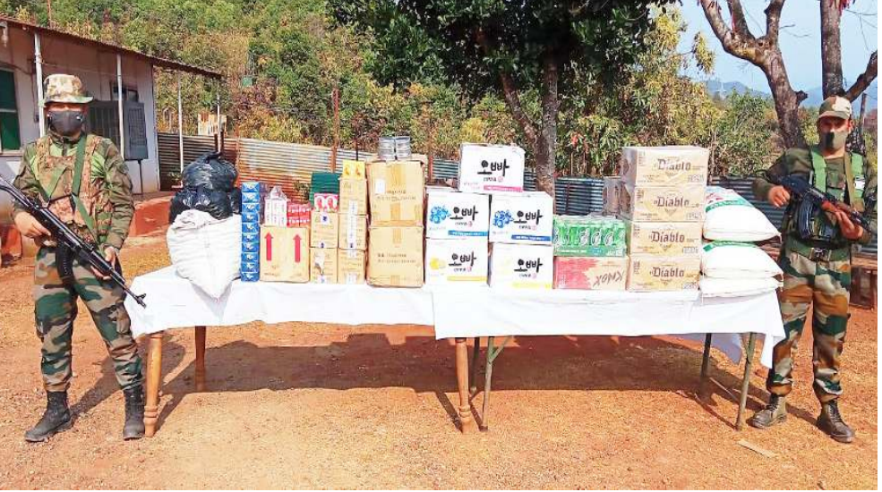
আই জি এ আৰ সাংখকী মীংয়েং মখাদা তেংনৌপা বট্ৰালিয়ননা থাংজ নুমিৎতা কাথা জঙ্কসন মনাত্তা গুমথৈ লান্না পুশিল্লকপা পোৎলমশিং ফাখিবিগী শঙম