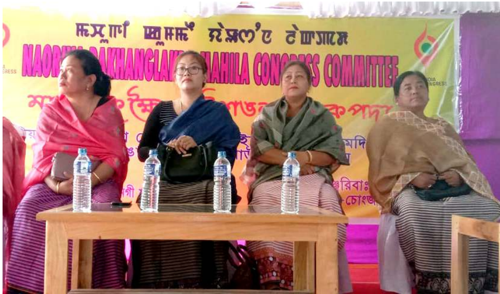
য়াশং কুইনা লাৰুপদা নাওৱিয়া পাখঙলাকপা কেন্দ্ৰীয়া মহিলা কোংগ্ৰেস কমিটিৰ শীৰ্ষস্থানত মেকোলাদা লৈবা ডা. সোৱাইসম মনাওনোৱী ময়ুমদা পাঙথোকখিবা কেন্দ্ৰ অসিগী মনুংদা লৈবা নুপী ওইবিংশগা পুৰুমেন পাউমেগবগী খৌৱমদা শৰুক য়াখিবাংশ

অগৰতীলা, মাৰ্চ ২৬ (এঞ্জেলী): হৌখিবা কুমজা ২০১৬ তা অজিকৰ্দিদন জলাল কৌবা মীওই অমা হাংপদা চেম্বা নুপী অমদি জলালগী মনাওনুপা ঙসি নোৰ্থ ত্ৰিপুৱা দিষ্ট্ৰিক্ট এন্ড সেশন জজনা মপুসি চ্ৰুমা জেলগী ফাদোক পীত্ৰে হায়রি।