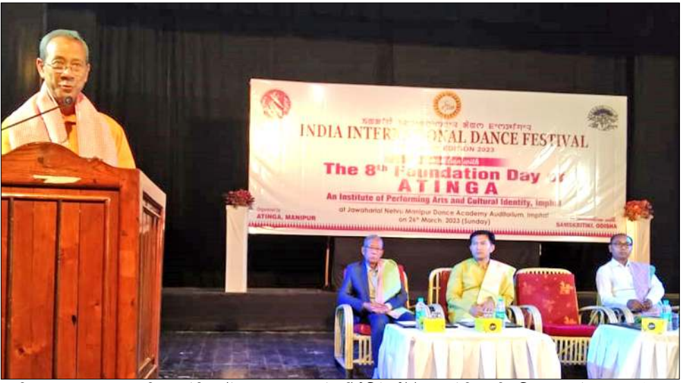
মণিপুৰ প্ৰেস ক্লবতা পাঙথোকখিবা পৰ্ধেহিং আৰ্টস এন্ড কলচাৰেল আইদেণ্টিটীগী ইন্সটিটিউট অমা ওইৱিবা অতিষ্ঠাগী ৮ শ্ববা ফাউণ্ডেশ্যন দে যৌৱম

মহাক্কা মীয়ামদা গভৰ্ণমেণ্টনা ফোৰেণ্ট এৱিয়া অমবু ৱাইল্ড লাইফ ৱিজাৰ্ভ অমদি প্ৰোটেণ্টেড এৱিয়া অমনি হায়না লাউথোজ্জনা লম কন্সৱেল তৌনবা অমদি ইনভাইৱনমেণ্ট টদা শোকহনগদবা প্ৰোজেক্টশিং পায়খৎনবা হোংনৱক্লিৱু যাদনবু পাউজাক গীথি।