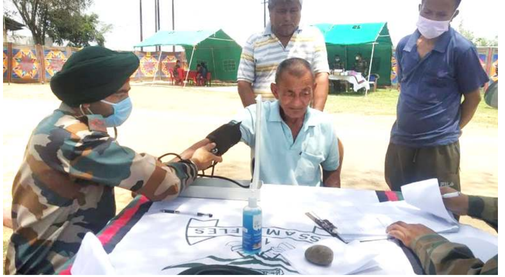
মন্দিপুস্তি বটালিয়ন অসাম ৰাইফল্‌সনা শিপ্‌দুনা ইম্‌ফাল ইষ্ট দিষ্ট্ৰিক্টকী মনুং চনবা শওৰুদা পাণ্ডথোকখিবা লেমা লায়েংবগী থোৱম

ফৌ গেছ থাদুনা শেল য়ান্ৰা তানবা য়াবগুম শিং থাদুসু চহীগী ইনকম য়ান্ৰা চাওনা জেনৱেট তৌবা য়াই। শিং হাৱিৰা অপীকপা পান্দি মখল অসি মীওইবগী হকচাংদা য়ান্ৰা কামবা পীৰগা লোয়ননা মালেমগী মীয়াম য়ান্ৰা দিমাং তৌৱক্সিবা অমনি। মৱম অদুনা শিং ফজনা থাদুনা লৌমীশিংনা চহীগী শেহতোক য়ান্ৰা লৈহমবা হোংনসি। লৈঙাক্সা মায়কৈদগী লৌমীশিংনা পায়খংলকপা অনৌবা খোঙথাকশিংদা চাওনা মতম তেং পাংবা মতম পুন্সদা শেম শাদুনা লৈ হাৱনা মহাক্সা মখা তাখি।