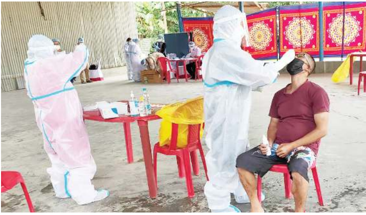
মেম্বৰশিংগী মতেংগা লোয়ননা পাঙথোকখিৰবনি। টেষ্ট তৌখিবা অসিগী সোসাল ব্লেফোর কম্মিটিগী ডল্লিগু টয়রশিংনস মীয়ামু মতেং পাংখি। কোভিড-১৯ লায়না-লাইচৎতগী মীয়ামু গুাকথোক হৌননবগী পান্দমদা টেষ্ট তৌবগী যৌরাং অসি পায়খংখিবনি হায়রি।

ইম্ফাল, মে ২৬ (এইচএনএস): হুইদেটস ব্লেফোর কম্মিটি (এস দল্লিগু এক সী) ক্লব বিলিফ কম্মিটি অমদি থোংজু এ সী বার্ড লেভেল টাঙ্ক ফোৰ্ড কোভিড-১৯না ইম্ফাল ইষ্ট দিষ্ট্ৰিক্টকী সী এম ওগা খুংশন্নরগা ওসি থোংজু পাৰ্ট টু ফৈজালৈতোংদা লৈবা কম্মুনিটি হোলদা মীওই ১০০ কোভিড-১৯ টেষ্ট তৌবদা মীওই ১১ পোজিটিভ ওইরল্লে থেংনল্লে হায়রি।