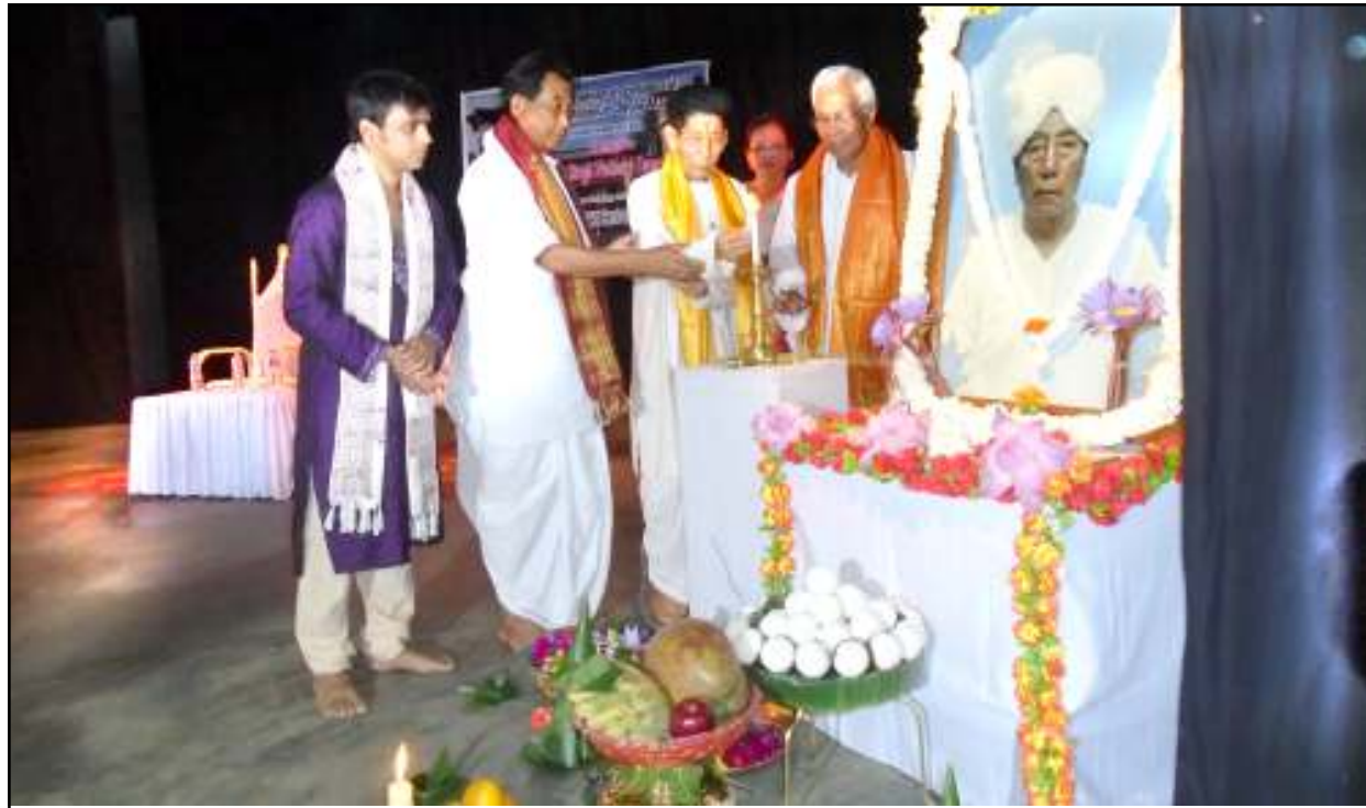
গন্ধারবী, ধামর দাস ইনষ্টিটিউট মণিপুর জগেই মরুপকা পুমা শীদুনা পাণ্ডথোকপা গুরু টি এচ বাবু সিংহ পদাশ্রী নেসনল দাস ফেষ্টিভেল হৌদোকপগী যৌরম