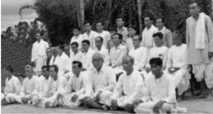
ইপাথৌকোক্রা শিনখিবা পেনা ফেষ্টিভেলদা শৰুক য়াখিবা অশৈবশিং

থেংনখিবদগী মহাৱাজকুমাৰী বিনোদিনীদা পাউদমদুনা জৱহৱলাল নেহৰু মণিপুৱ ডাল একাদেমী প্ৰডক্‌ন য়ুনিটকী বেলে কৈবুল লমজাউগী পেনাগী মুজিকসিয়ান অমা ওইনা নেকচখি অমদি মখা তানা একাদেমী প্ৰডক্‌ন য়ুনিটকী থবক পুখি। একাদেমী হেক চঙখিবদগী একাদেমীগী প্ৰডক্‌নশিংগী অচিনবা কয়া লৈৱকপনা মৱম ওইৱগা লাই হৱাউবগী যৌগল লেপখি অদু ওইজৱগসু লৈপাকী ওইবা খৌৱমশিং অমদি পেনা যৌগল চঙগদবা লাই-তিনগী, লাইনিং লাইশোলগী ওইবা খৌৱমশিংদি ওবা লাইশ্ৰম লৈবাক মচা শৰুক য়াখি।