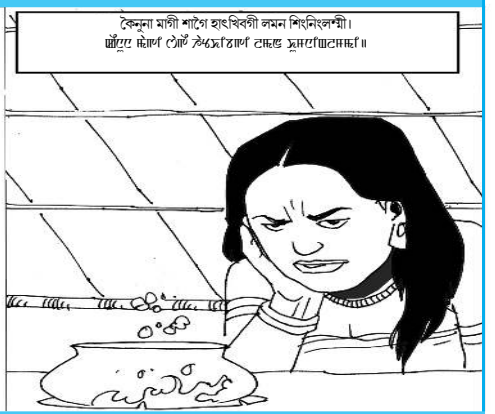
কেন্দা মগী শাগৈ হাখিকী লমন শিখিলেকনী।