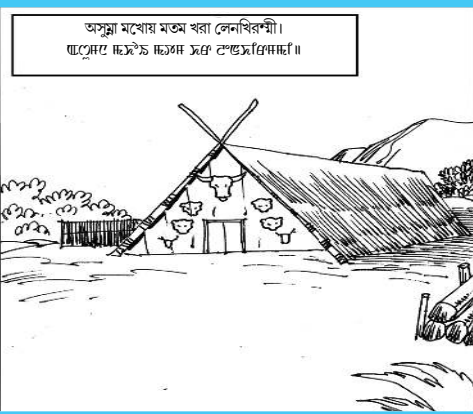
অসুমা মগী মতম খৰা লেনবিৱনী।