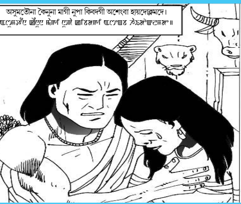
অসুমা মগী নুপা বিকদগী অশেবা হায়লেক্সমে।