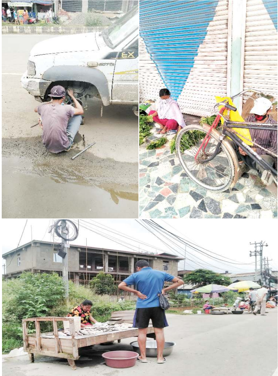
মিতম্হম হায়বসি য়ান্না য়ান্না পীগদবনা, ইশাগী অপায়গা মিতম্হমগা বদায় ফাওবা লাগ্গা নংত্রগা বদায়ফাওবা নগ্গা য়াই। অপাশা, অরাবা ওমমসু মতম জোশিমরি।