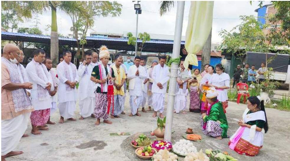
উৱা শঙলেন সনা কৌনুনা শিন্দুনা ওৱাং অয়ুক সনা কৌনুনা পাঙথোকখিবা থৱান থাগী ২৯ নি পানবগী থৌৱমদা শৰুজা য়াখিবশিং

পনবা যাবদি হৌখিবা কুমজা ২০২০ গী মে থাদনী হৌৱগা ইন্দিয়া অমসুং চাইনাগী মৱজা ওমখৈগী মতাংদা উংখনবগী থৌদোকশিং থোজুনা লাক্ৰি। নাকল অনীগী ওইনা ওমখৈগী শৰুজা মথৌ তৌৱিবা সিকুৱিটি পৰ্সনেলশিংগী মৱজা উংখনৱকপদগী মীশি মীনা ফাওবা থোকশ্বে। অমৰোমদা অমৌবা পাউ অসিগা মৰী লৈননা ইন্দিয়গী মায়কেন্দগী হৌজিক ফাওবগী ওইনা কৱহা এজ্ঞান লৌখৎবগে হায়গী মতাংদদি চপ চানা খঙবা ওমদি। অমদি মৰী লৈনবা ওফিসলশিংগা পাউ ফাউনবা হোংনবদসু ওমদি হয়ৱি।