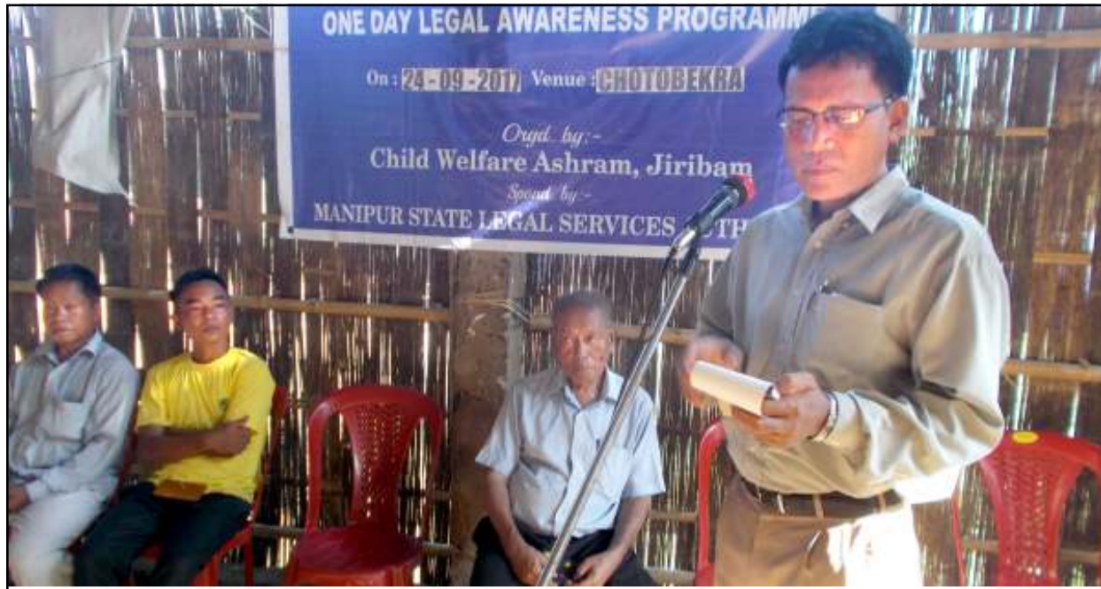
চাইল্ড ৰেলফেৰ আশ্ৰম, জিৰিবামনা শিন্দুনা মণিপুৰ ষ্টেট লিগেল হেল্প সৰ্ভিচেস এছোসিয়েটী মীংয়েং মখাদা ছোট্টোবেক্ৰাদা পাড্‌থোকপা লিগেল এৱেৰেনেস প্রোগ্ৰাম

ট্ৰাফিক/অমাংথোঙ মনুংদা ফুৰিঙুমা তংলগা লৈবা, তংলগা লৈবা অদুদনী খোঙ হায়া খুদিংগী ঙৈ দ্ৰোপ-দ্ৰোপ তারকপা, খোঙ হায়া চাং নাইদবা অমদি মতম কুইনা চঙবা, অমাংথোঙদা মৱেং-মৱেং চংলগা য়ান্না হাক্‌চবা, পুজা নুংশিং কাৱগা চাবা-থকপা যাদবা ফহনবগী ওজাবু খাগ্‌চরি