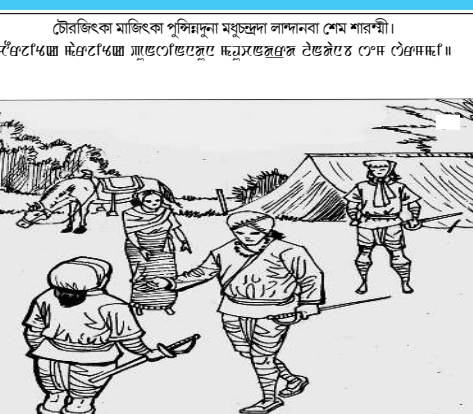
মতুংইয়া মাইথিবা পীদুনা চহী ৫/৫ পামসি হায়না যানবিশী। মতুংইয়া মতুংইয়া মতুংইয়া মতুংইয়া মতুংইয়া মতুংইয়া