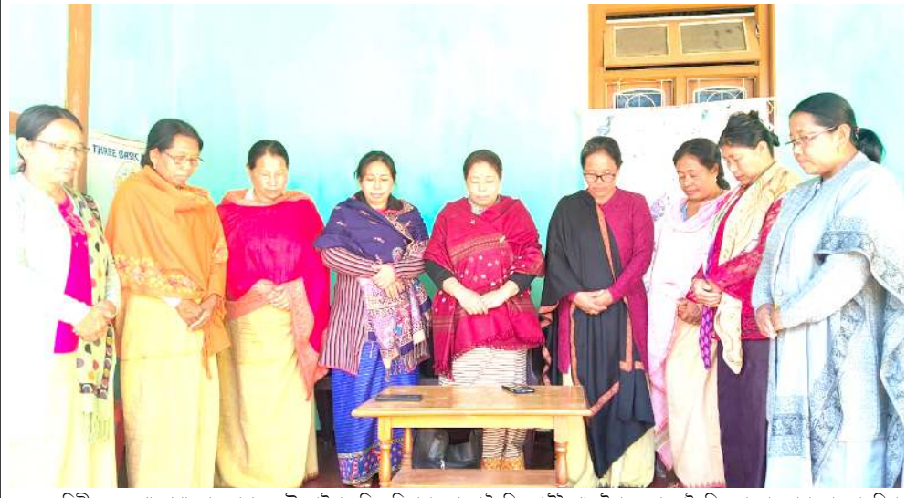
লমদম অসিগীদমক কথোকপগা লোয়না থবক তৌৱদ্বা ইমা অৱিবম সিতাৰা বেগমনা লৌখিবদা ষ্টেটপাক ষ্টীনাং চুৱা লৌখিনলোননা অৰাৰা ফোঙদোকখিবা

পি লৈহয়বা তকশিল্লগনি হায়ি। মহাক্কা মখা তানা ফোঙদোকখিবা, লৈবাক অসিগী অৰাং নোংপোক থংবা শৰুত্ৰা লৈরিবা ষ্টেটশিংদা লৈরিবা নহা কয়ানা থবক ফংদবনী অৰাৰা কয়া মায়োক্কাৰিঙৈ মৰক অসিদা ইল্লিগেল ওইবা মওন্দা মীতোপ কয়া চঙশিল্লকপা অসিনা মৰম ওইৱগা অমুকা হোম খুংচাদবা কয়া মায়োক্কাৰিঙৈ মৰি লৈনবাশিংনা অথবা মতমদা হোংনগদবনি হায়ি। অমরোমদা য়েলহৌমীশিংদা চাওনা চেংথেং পীৱকপা য়াৰা লৈরিবা সী এ এ সেন্টেনা অথবা মতমদা ৰিপিল তৌগদবনি। হায়িৰিবা এষ্টে অসি নম্বুদা ইমপ্ৰিমেন্ট তৌনবা হোংনগদবনি পামদবা খৌদোক কয়া খোৱকপা য়াই হায়ি।