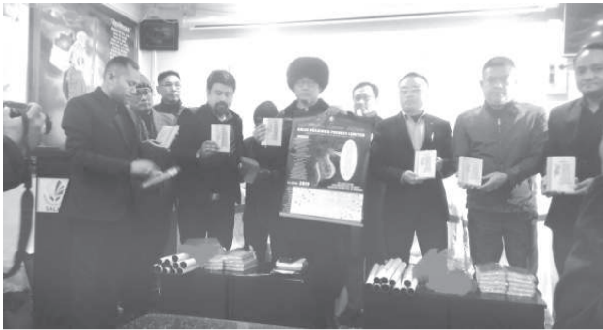
লমদমসিদা ফনবা ব্রাগী পোখোখিংশিং হৈ-শিংনা শিজিমদনা পুথোকপা সলাই হোল্ডিংস প্রাইভেট লিমিটেডকী দাইরি, কেলন্দর ফোঙা

ট্রাফিক/খোঙ হায়া খুদিংগী শৌজ নাহুবা, অমাঙথোং ময়াদা হরাই চানা মরুমক চাউবা অমা পোমথোকপা লেবা, ফিল্ডলাদা মখুল ছেলগা নাই চারকপা, অমাঙথোং মনুংদুং খুংনা থিনজিলগা য়েংবা মতমদা পোমগা লেবা ফননবগী ওজা জিয়া উল হগপু থাগৎচরি