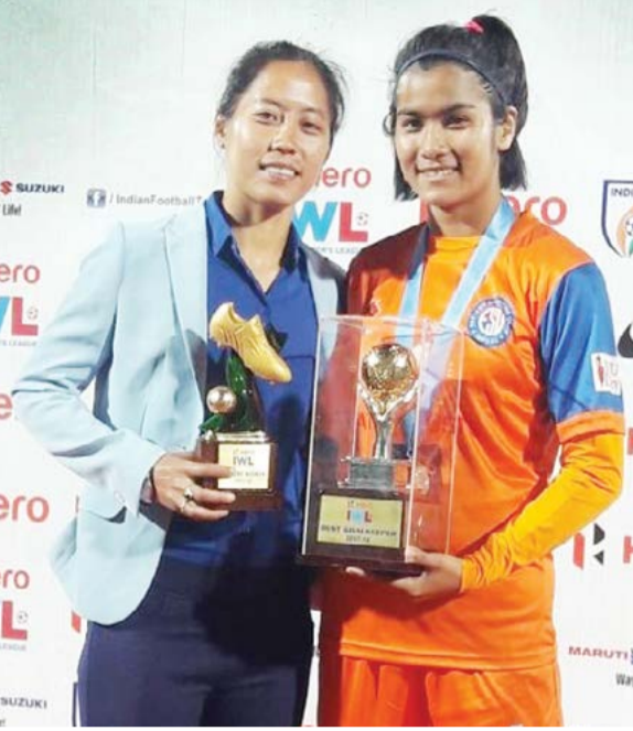
এলাংবম পাছোই চনু ইন্টেনসনাল ফুটবোলদা মশক থোক্লা মফম কনবা ওমজরকপদি কুমজা ২০০৭কী মতমসিদগীনি

এসোসিয়েশন ককচীংনুসু রিমেল ফুটবোল একাদেমি হাংদোরকুনা মদুদসু ঐহাক ত্রেনিং তৌদুনা শানজবা ফংজরকথি। তৌবসু ঐহাক ক্লাস ফোর কাবা মতমসিদগীনি