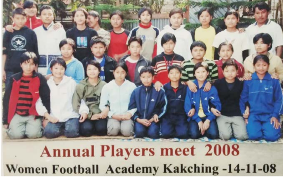
Annual Players meet 2008 Women Football Academy Kakching -14-11-08

গোলকিপরিলা ওইরকথি। ঐবি অহানবা ওইনা ত্রেনিং তৌবিকথিবা ঐগী ফুটবোল