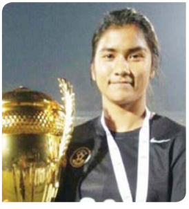
এলাংবম পাছোই চনু ইন্টেনসনাল ফুটবোলদা

এলাংবম পাছোই চনু, হৌজিক-হৌজিক মণিপুরগী নুপী ফুটবোলদা মশক থোক্লা মফম কনবা ওমজরকপদি কুমজা ২০০৭কী মতমসিদগীনি