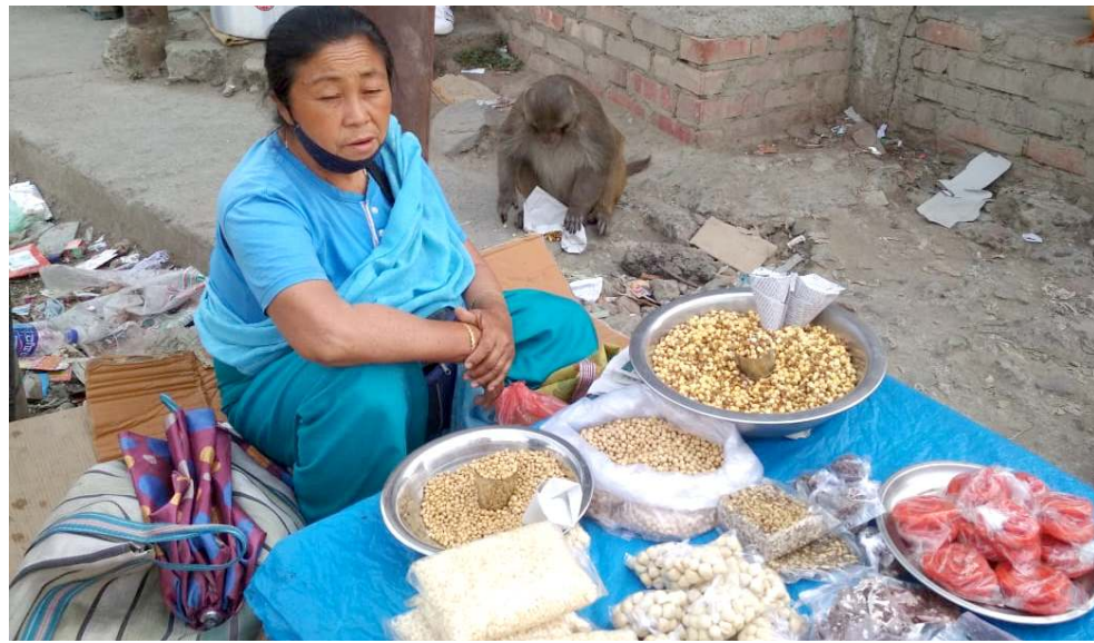
থা অমা হোয়া ইমা কেথেলগী মনুং অমসুং অকোয়বদা কোয়চং চতুনা লৈরিবা য়োনি। মহাবল্লিদী থোয়ুংপা য়োং ওইবনা মথোয়গী মফমদুনা চঙবা য়াদবদগী কেথেলগী অকোয়বদা লৈরকপা থা অমা হেলে হায়না পোংফম ফদী অমনা ফোঙদোরকি

ইফল, মার্চ ২৭ (এট এন এস): সনাতোন অথোকপমগী মতাংদা অচুয়া পুরকউ হায়দুনা খুরাইদা রেঞ্জি চংখ্রে