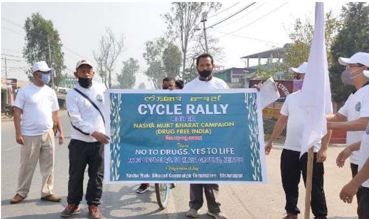
চখিবা সাইকল রেঞ্জি অদুনা লম্বোলদগী কৈনৌ ফাওবা লাক্সা মতুংদা ক্লাসা

ইফল, মার্চ ২৭ (এট এন এস): নাশা মুক্তা ভারত কেম্পেইনগী