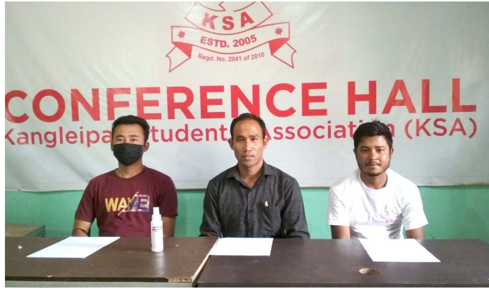
থোয়াথোংদা লৈবা কংলেকাৰ্ণ ষ্টুডেন্টস এসোসিয়েশনগী ওফিসতা পাঙথোকখিবা মতম হেল্ঠবা অজ অথকশিংদা অনৌবা লেবেল নপশিদনা পোং য়োজিৱা দুকানশিংগী মথজা এন্ডন লৌখংনবগী মতাংদা পাঙথোকখিবা পাঙ্ডী মাকমদা শৰুক য়াখিবশিং

গুৱাহাটী, এপ্ৰিল ২৭ (এজেন্সী): অসামগী ষ্টেটকোভা হৈজিক কোভিড-১৯ লায়োভদা মৱু ওইনা শীজিৱাৰিবা ব্ৰগ ৱেমেদেসিভিৰ ভায়ল ২৫,০০০ লৈ হায়না হায়দনা ষ্টেট অসিগী হেল্ঠ এন্ড ফাইনাল মিনিষ্টৱ মিষ্ট্ৰা বিস্ত্ৰ সৰ্মনা হীদাকশিং অদু অৱাং নোংপোক ষ্টেটশিংদা শীজিৱাৰি হায়না ফোঙদোকশ্ৰে।