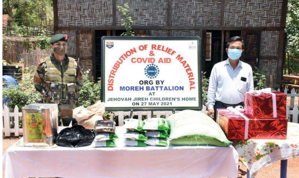
ইসাপেঞ্জৰ জেনৱেল ওফ অসাম ৱাইফলস (সাইখ) কী মীংয়েং মখাদা মোৰে বটালিয়নগী এ আৰ পৰ্সনেলশিংনা মোৰেদা লৈবা জে জে চিলড্ৰেন হোমদা ফেস মাৰ্ছ, হেদ প্লোভ, সেনিটাইজৰ অমদি চানা থক্ৰা পোংলমশিং থেংবাংশিবা

গুৱাহাটী, মে ২৭ (এজেণ্ডা): ইন্দিয়ান অৰাং নোংপোক থংবা ষ্টেটশিংদা কোভিড-১৯ লায়না লাইচং শব্দোকপগী চাং হুইবাকপগী ৰাফম লৈত্রি হায়না মৰী লেনবা ষ্টেট ষ্টেটশিংদা দিশাটমেন্টশিংনা ফোঙদেৱকপগা লায়না অহেনবা চেকশিন যৌৱাংশিং মখা তানা লৌখংপা হৌশ্ৰে হায়রি।