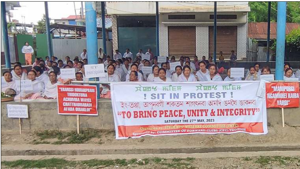
ছুদেটস বেলফোর কশিটিনা কশিটি ওন ফোরবার্ড ক্লবস থোংজুনা খুংশুদুনা লমদম অসিদা ঈং তপ্পা পুরকুবা নিমাদ তৌগদুনা ফেজালৈতৌংদা বাক্চ মীফম ফমখিবা

মণিপুরগী ওমখৈগী শরুক কায়হন্দনা থায়া, লমদম অসিদা খুদামিন্নরিবা য়েলহৌ ফরুপ খুদিংমক্কা অমতা ওইনা থবক তৌমিন্নবা অমদি মণিপুরগীদমক এম এল এনা থবক থোরমশিংদা মীয়ায়্মা মতেং পাংবা অমদি মণিপুর অমদি সগোলবন্দ এ সীগী মীয়ায়্মা লোয়ননা থবক তৌমিন্নবা হায়বা রাফমশিং য়াওরি।