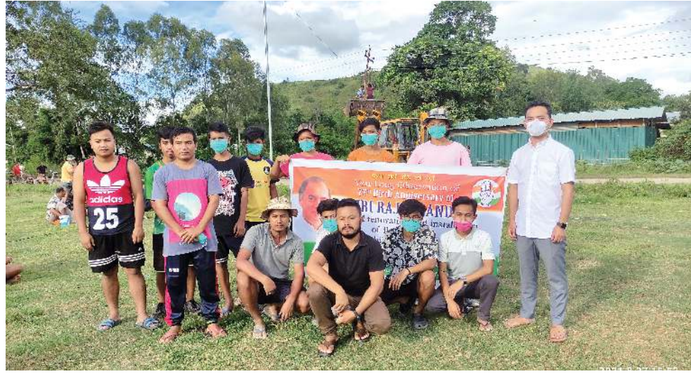
ইন্দিয়াগী প্রাইম মিনিষ্টর ওইরগা লেখিড্রা বরজিত গান্ধীগী চী অমা চুপা চখগদবা ৭৭ শুব মপোক নুংমি থোরমগা মরী লেননা রাংজি তেহুয়া এ সীগী মনুং চনবা কাইরমনিথোক অরাং লেকায় শাবাবুদা মণিপুর প্রদেশ যুথ কোংগ্রেস কমিটিগী স্টেট কোর্ডিনেটর উশম মঙলেমনা মনুং লাইট থানখিবা

হৌজিক শাবা লোয়শিন্দ্রিবা মেগারাট ২,০০০ গী লরার সুবানসিরি হায়ড্রোলিক প্রোজেক্ট সাইটত চেংথং পীরকড়া হায়বা অসিনি। করিগুন্না ঈশিংগী ঈমায় মখা তানা হেনগংলকপদ শাবগী থবক চখরিবা দাম অসিদা অকয়বা থোরকনি। দাম অসি কায়রবদি দাম অসিগী মখা থংবা শরুজা লৈরিবা মফমশিংদা ঈচাও থোকহনশ্বে যাবগী অকিবা লৈ। অদম ওইনমক এন ঈচ পী সী ওথোরিটিশিংনদি হৌজিক ওইরিবা ঈশিংগী ঈভম অদনা শাবগী থবক চখরিবা দাম অদনা ইফেক্ট তোরোই। মরী লেনবিশিংনা হীরম অসিগী মতাংদা যান্না কুপা য়েংশিদনা পায়খং পা য়া চেকশিন থোরশিং পায়খংলি হায়রি।