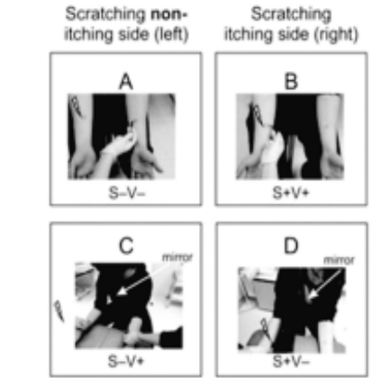
Scratching non-itching side (left) and itching side (right) with labels A, B, C, D and S+V-, S+V+, S-V+, S+V-.

ওইদুনা কাপশিনত্ৰিবা মফমশিংদুনা সেণ্টিমিটাৰ ১.৫ কী দাইএমিটাৰ ওইবা অঙাংবা দাগ লৈৱকথি অদুগা সেকেদ ২ ৫ গী মতুংদা হাক্চবা হৌৱকথি। মিনিট অমমুক ফাৱকপদদি হাক্কচৰগী চাং য়ান্না