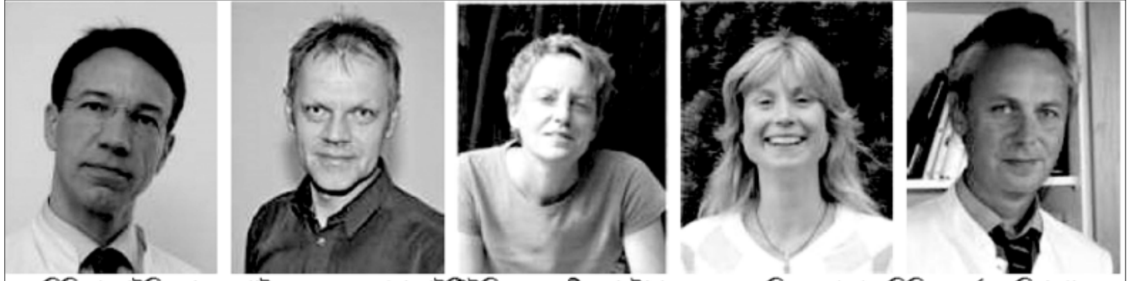
মেদিসিন্দা আইজি নোবেল প্ৰাইজ ২০১৬ ফংথ্ৰবা সাইটিট্টিশিং (ওয়দদগী) : খৃট্টোপ হেন্নাচেন, এন্দ্ৰিজ স্পেংগৰ, সিক্কি এন্দ্ৰস, কেৰিনা পালজৰ, টোমাস মুত্তে