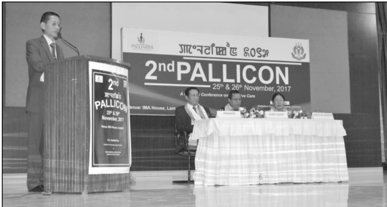
লক্ষ্যপাওতা লৈবা ইন্দিয়ান মেডিকেল এসোসিয়েশনগী ওফিসতা পাওথোকপা সেকেন্দ পোল্লিকোন লৌইশিনবা থৌরমগী শজম অমা