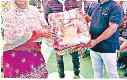
ওল সোরা ক্লাবস কোর্ডিনেটিং কমিটিয়া ময়াই কাবা চিঞ্জাকশিং পাউমীশিংগী মমাঙদা মে থাদোকুনা মাঙহনবগা লায়ননা ইমুং ৮০নী মীওইশিংদা নীংখম খুদোল তমখিবা