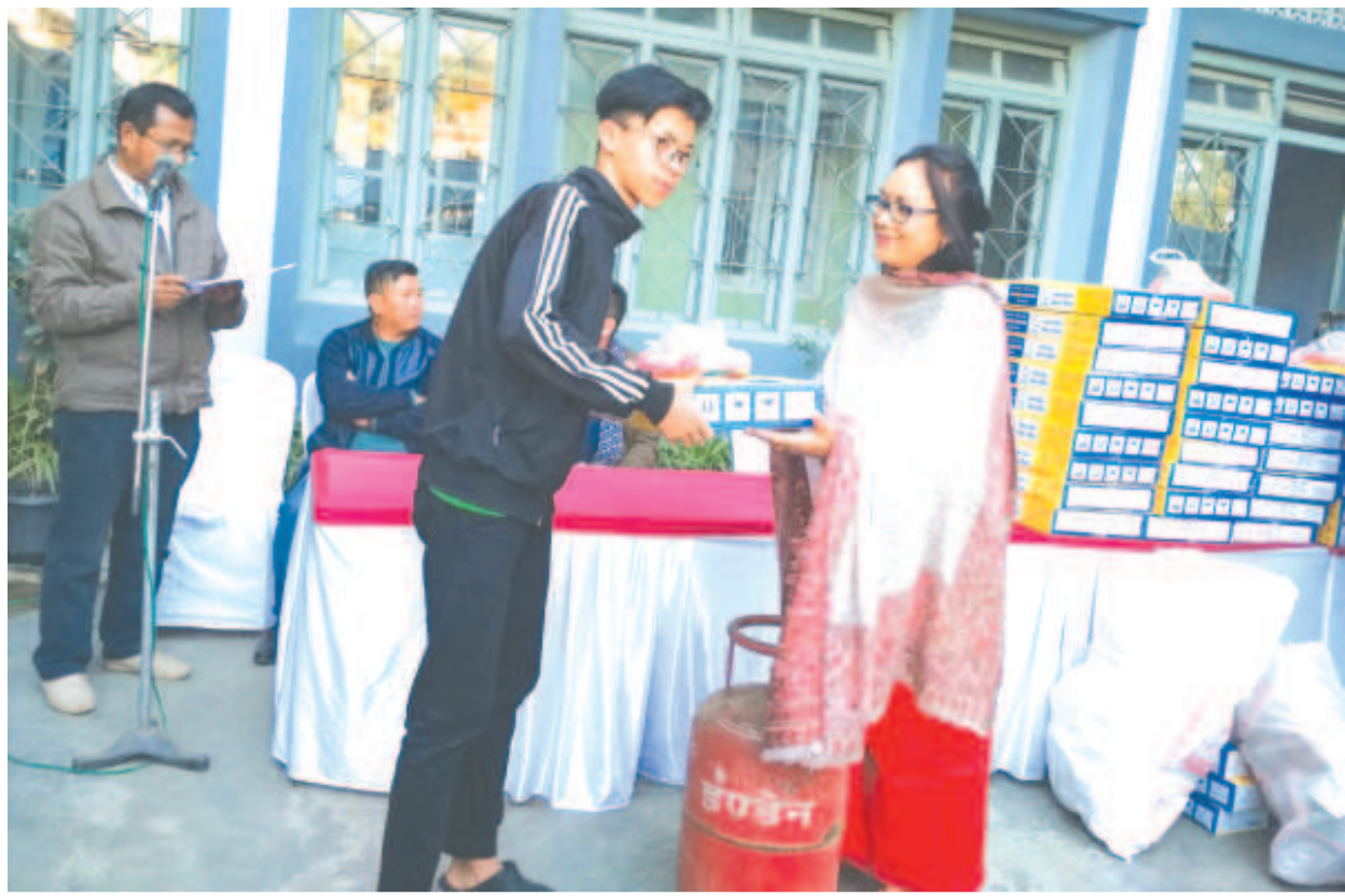
বাংখৈ এ সীগী মনুন্দা লৈবা গ্যাস কনভেন্সন ফংদ্রিবা মীওইশিংদা থাংজম অরুণকুমারনা লোন্না গ্যাস কনভেন্সন ফংহন্দুনা পোৎলমশিং য়েহ্মোকপা