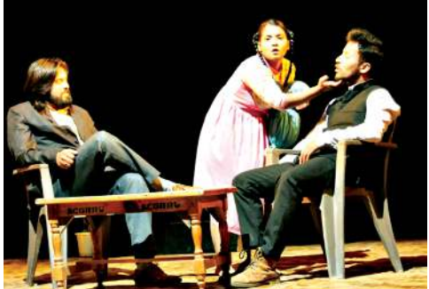
গী জানুৱাৰী ২ ফাওবা চখগদবা নোৰ্থ ইষ্টকী নুপী দিৱেস্তাৰশিংগী ওইবা ড্রামা ফেস্টিভেল অসি থা অসিগী ২৪ দা হৌদোকখিবনি। সেমিনাৰ য়াওনা ফেস্টিভেল অসি পাঙথোকপনি।

ইফাল, দিসেম্বর ২৭ (ঐচ এন এস): খেঞ্জোংলাং ইফালনা জে এন মণিপুৰ দাল একাদেমী অমদি সপ্তীত নাটক একাদেমী নু দিল্লিগা খুংশয়না শীন্দুনা কৈৱাওদা লৈবা খেঞ্জোংলাংগী ড্রামা হোলদা চখরিবা নুপী দিৱেস্তাৰশিংগী ওইবা ড্রামা ফেস্টিভেলগী মৱিনি চনবদা ৰিংস ঠিএটৰ, অসামগী হেলেন হায়না মিথখোনাবা ড্রামা উংখে।