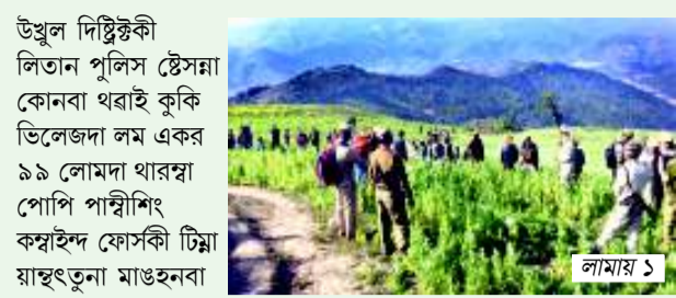
উখল দিষ্টিক্কী লিতান পুলিস স্টেশন কানোনা থৰাই কুকি ভিলেজদা লম একর ৯৯ লোমদা থারহা পোপি পান্ধীশিং কন্বাইদ ফোসকী টিয়া মাঙহনুনা মাঙহন