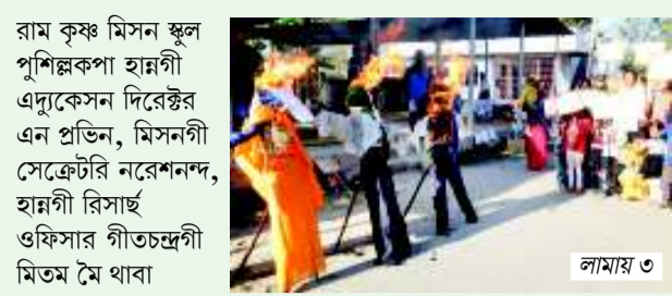
রাম কৃষ্ণ মিসন স্কুল পুশিকপা হান্গী এনুকেসন দিরেক্টর এন প্রভিন, মিসনগী সেক্রেটারি নরেশন্দন, হান্গী রিসাই ওফিসার গীতচন্দ্রগী মিতম মৈ থা