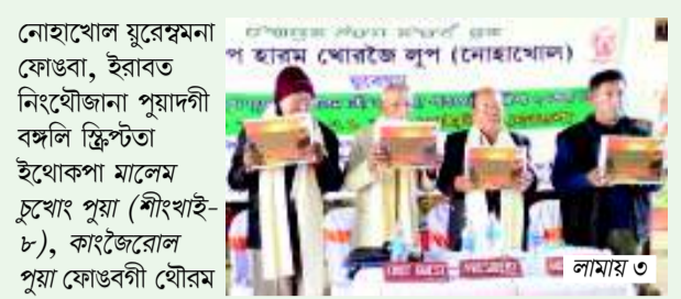
নোহাখোল যুরেশমনা ফোঙবা, ইরাবত ইন্থোজানা পুয়াদনী বঙ্গলি স্ক্রিপ্টা ইথোকপা মালেম চুথোং পুয়া (শিংখাই-চ), কাংজৈরোল পুয়া ফোঙখনী যৌরম

থাউগী মমল ইমফাল ইট অমসুং বেষ্ট দিষ্টিক্কি পোলেটাল : লিটেরাদা লুপা ৭০.৯৮ দীজেল : লিটেরাদা লুপা ৬২.০৭