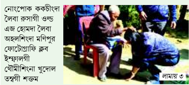
নোংপোক ককচাঁদা লৈবা কুসাগী ওল্ড এজ হোমদা লৈবা অহলশিংদা মণিপুৰ ফোটেগ্ৰাফি ক্লাব ইমফালগী যৌমিশিংনা খুদোল তহনী শক্তম