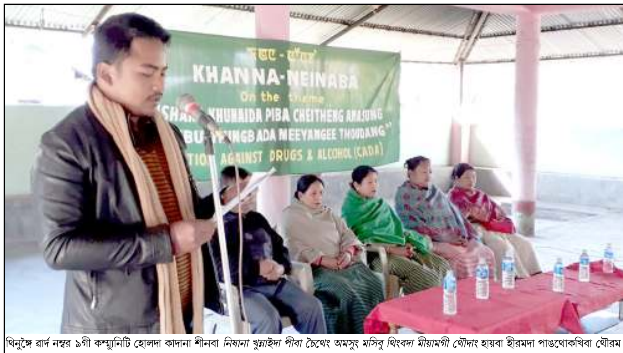
খিনুদৈ বাদ নম্বৰ ৯গী কম্পানিটি হোলদা কাদানা শীনাৰা নিয়ানা খুইদা পীবা চৈথেং অমসুং মসিবু থিংবদা মীয়ামগী যৌদং হায়বা হায়মদা পাঙথোকখিবা যৌৰম