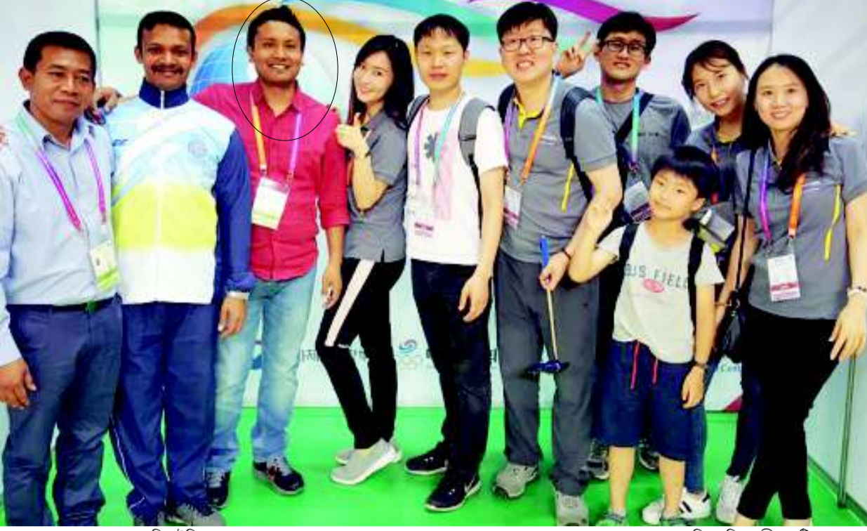
অসুম হায়না শেমগংপা জিয়াষ্টিক অসি চী খুদিংগী সাইনা স্পোন্সর তৌরগা পাঙথোকপা নেসনল স্পোর্টস টেলেন্ট কন্টেস্টতা শরুক য়াহক্লি। মণিপূরগী ওইনা তৌবা কন্টেস্টতগী প্লেয়র নুপা অহম/নুপী অহম খল্লগা নেসনল স্পোর্টস টেলেন্ট কন্টেস্টসিদা হেক হেক খাই। ওল ইন্দিয়াগী ওইবা কন্টেস্টসিদগী অমুক প্লেয়র ১০/১০ সেলেক্সন তৌই। খল্লংলবা টেলেন্টে টদশিংদু সাইনা স্পোন্সর তৌরগা স্পোর্টস ফেসিলিটিফজনা লৈবা অফবা স্কলশিংদা তমহক্লি। ঐহাক ইশামকসু কুমজা ১৯৮৮ দা তৌখিবা নেসনল স্পোর্টস টেলেন্ট কন্টেস্টতা মণিপূর ষ্টেটতগী খল্লংলবা শামরায় নুপা অহমগী মনুংদা অমা ওইখি।

অজং ওইরিঙে মশাগী চী ৮/৯ হায়রকপা মতমদগী অশোঙা ঋইদগী পামজবা গেমসি জিয়াষ্টিক ওইরকখি। মরম অদুনা পীক্লিঙেদগী খুৰাই লাইরিকয়েবম লৈকায় তামা চ্চত্ৰনা জিয়াষ্টিক শামবাহৌরকখি। কৰম কৰহা অসিনা লীরকখি, ঐগী ওইনদি জিয়াষ্টিক অসি য়ালা পামজবা গেম অমা ওইরকপনা দইরেক্ট শামবা অদুম হৌরকখি। .খোয় শামবরকপসি লাইরিকয়েবম লৈকায়দ সাইকল তেংদনা চেলগা অদুম শামবা হৌরকখি। জিয়াষ্টিককী ওইনদি শামবফমসিসু কয়া লৈতে। ঐখোয়বু তাকপী ওজাসিসু তা খোইজাওবা হায়বা অমগা ওজা অজ্জৈ হায়বা অমগা অনীসিদনি। লাইরিকয়েবম লৈকায়দ শামবসিসু ঐখোয়না ঋইদগী অজংনি। মতাদ্দা প্লেয়রসি পুরা ৪০/৫০ মুক্ৰি ঐখোয় ফনা যাস্মী। ওজা অনীসিদা ঐখোয় পল্লমকসি য়ালা কেকশিমা অদুম তকপী।