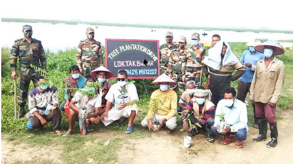
আই জি এ আৰ (সাউথ) কী মীংয়েং মখাদা লোক্তাক বটালিয়ন অসাম ৰাইফলসনা শিন্দুনা কোম্পাখোঙ ভিলেজদা উ চাৱাশিং থাখিবা

দিৱেজ্ঞনশিং অদু ইন্স্পেক্টিং তৌনবা মৰী লৈনবশিংদা খঙহনখিবনি। নেসনল গ্ৰিন ট্ৰিনেল অমসুং সূপ্ৰিম কোৰ্টকী দিৱেজ্ঞন ষ্টেট লৈঙাকী মৰী লৈনবশিংনা হৌজিক ফাওদা ইন্স্পেক্টিং তৌনবা লৈৱমখিবা অদু কোৰ্টনা নুংওইতবা ফোঙদোকখিৰগা লোয়ননা ইন্স্পেক্টিং তৌনবা খঙহনখিবনি। কৱিগুৱা হায়ৰিবা চয়াল মৰিগী মনুংদা ইন্স্পেক্টিং তৌবা ঙমদবদি কেস অমা লৌখনুৱা ঙমদবগী মৱম খিজনিগনি হায়ৰি।