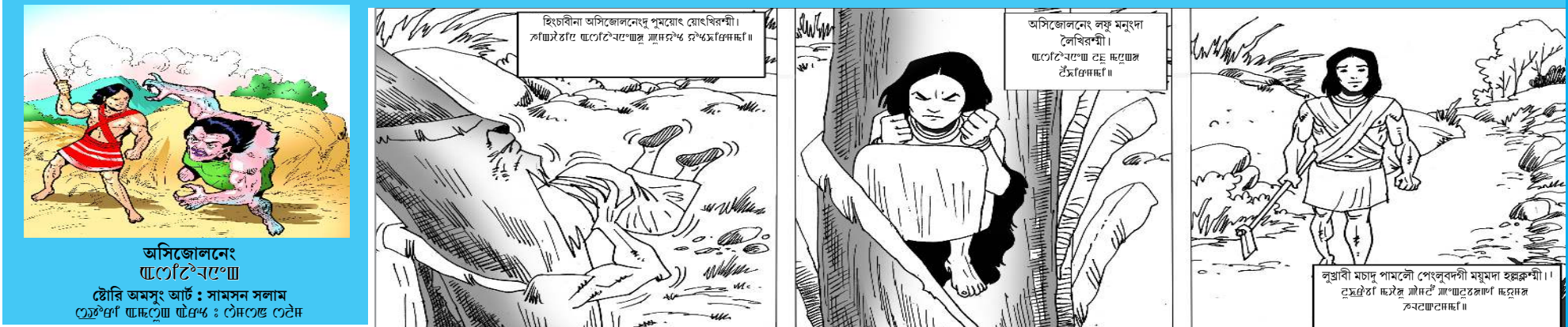
অসিজোলনেং... স্টোৱি অমসুং আৰ্ট: সামান সলাম