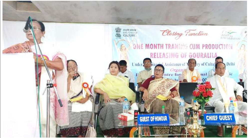
উতলৌ ময়য় লেকায় কম্যুনিটি হোলদা পাঙথোকখিবা গৌড় লীলা ট্রেনিং লেইশিনবগী খৌরমদা মরুওইবা মীওইশিং ওইনা শরুক য়াখিবশিং