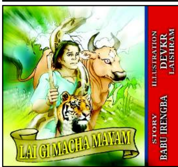
STORY BY BABU IRENGBA

অট্টোবা পকপাশিনা খৌতিনা রানিংঙাই লৈয়ে। মতম চানা লায়োংবদদি অট্টে অনাবাঙর ফহনবা ওশী। অট্টোবা পকপাশিনা অফনা মখলগী হিদাকশিং শিজিহান্দা অনাবা মীওইশিং কমা ফহনবা ওমদে। অমুংজ লাকপীদনা অফনা মখলগী অনাবাশিং পুংফা ফহনবীম।