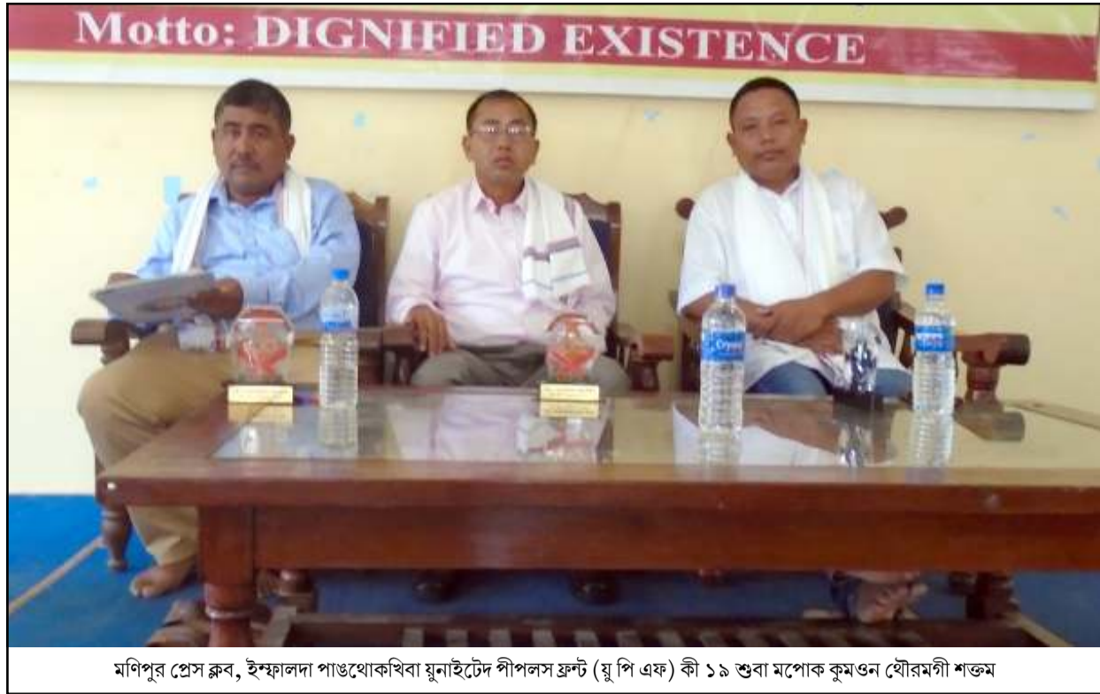
মণিপুর প্রেস ক্লাব, ইম্ফালদা পাণ্ডাখোকাবিবা যুনাইটেড দীপলস ফ্রন্ট (য়ু পি এফ) কী ১৯ শুব্বা মপোক কুমওন যৌরমগী শক্তম