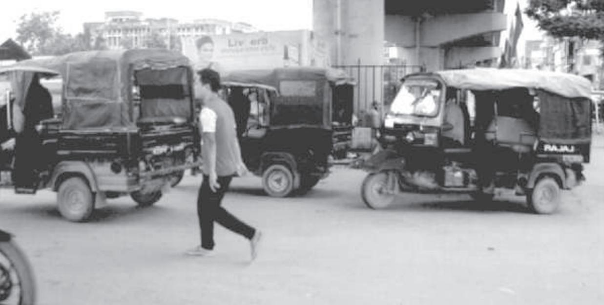
উৱিপোক কাংচুপ ৱোদকী ময়াই চবুজা ফ্লাই ওভর ব্রিজ মখাদা নোং হেক গুনবদকী নুমিং তাবা ফাওবা নিয়ম লামা খামদুনা লৈৱিৰা দিজন ওটোশিং

ট্যাম্‌ৱাৰ্চ/অমাঙথোং ময়াদা মচা অমা পোমথোৱুগা লৈবা, খোঙ হান্না চাং নাইদবা, অমাঙথোংগী অকোয়বদা য়াম্মা হাক্‌ৎচবা, খোঙ হান্না খুদিগী দ্‌ দ্‌ৱোপ দ্‌ৱোপ তারকপা, পুজা গোপ্তিক কাৱগা য়াৱোমদা তেয়না তেয়না খেগৎপা ফহনবনী ওজা জিয়া উল হগপু খাগৎচৱি