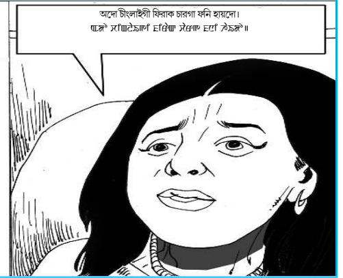
অদে চিলাইগী ৱিৰাক চৰণা ফনি হায়েদে।