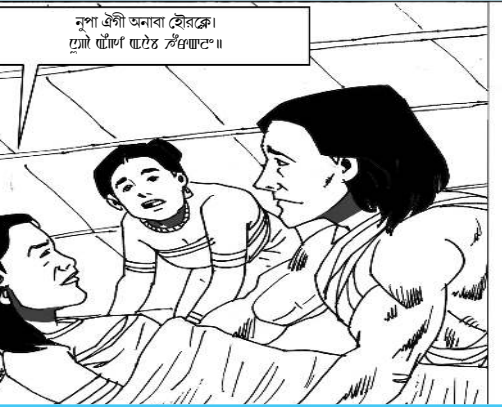
ইপামসু অদু নাৱকই মসিগীসে।