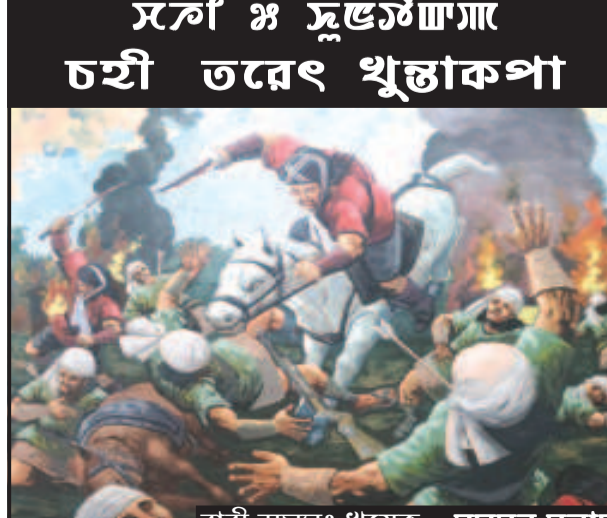
রারী জয়সুং খুয়েক - সমসন সলাম