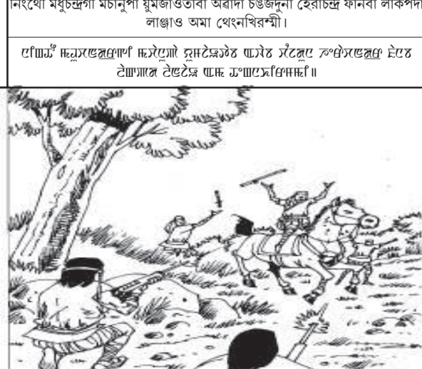
নিংথৌ মখুংজুগী মচাশুনা মুমজাওতা বাবা চঙজুনা হেরাচন্দ্র ফানা লাঙ্গপদা লাঞ্জাও অমা থেংখিবশ্শী।