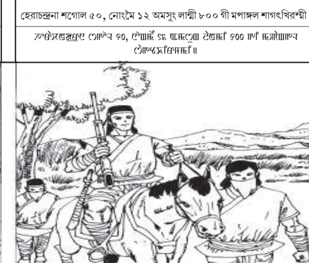
হেরাচন্দ্রনা শগোল ৫০, নোংম ১২ অমসুং লাম্বী ৮০০ গী মপাঙ্গল শাগংখিবশ্শী।