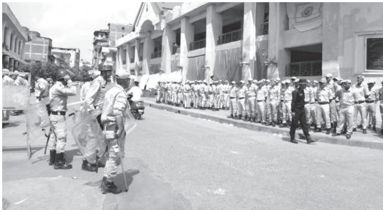
মহৈরায় লূপ তরুকা কৌখিবা জেনরেল টাইক মনুংদা পুলিস পসনেলশিংনা ইম্ফালগী স্থাইরবদ কৈথেলদা চেকশিন-খৌরাং লৌখং পা

ট্রাফিক/খোঙ তোয়না হায়া, খোঙ হায়া মতমদা কোঙ্গোল অমদি মনাংগা লোয়নরকপা, অমাঙথোং ময়াদা পোমথোক্কাগা লৈবা, খোঙ হায়া খুদিংগী মনুংদগী মচা অমা ইন্থরকপা অদুগা মশানা অমুক হনগংখিবা, খোঙ হায়া লোয়রগা অমাঙথোং মনুংদা চিকপা অমদি শাবা ফহনবগী ওজা জিয়া উল হগপু থাগংচরি