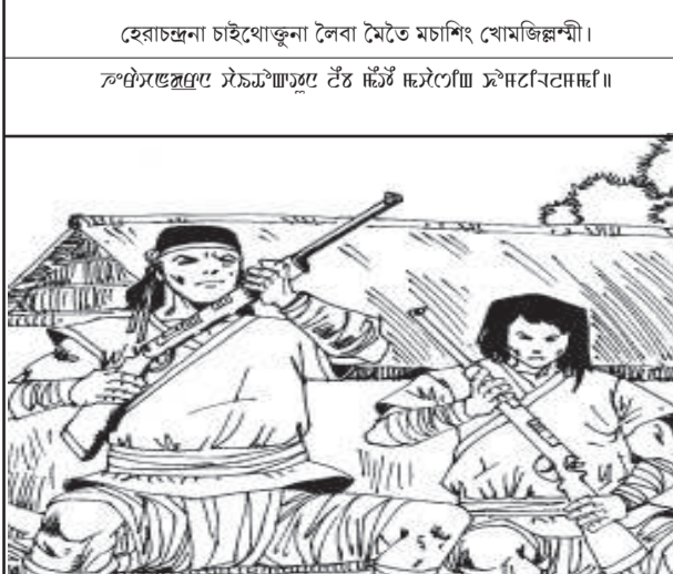
হেরাচন্দ্রনা চাইথোক্তুনা লৈবা মৈতে মচাশিং খোমজিল্লশ্শী।