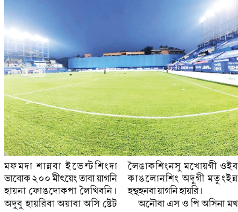
মফমদা শামবা ইভেণ্টশিংদা ভাবোক ২০০ মীংয়েং তাবা য়াগনি হায়না ফোওদোকপা লৈখিবনি। অদুৰ হায়ৱিবা অয়বা অসি ষ্টেট

নু দোল্লি, দিসেম্বৰ ২৮ (এজেন্সী): ইন্দিয়ানী স্পোৰ্টস মিনিষ্ট্ৰিগী মায়েকৈদগী নৌনা ফোওদোকপা ষ্টেণ্ডৰ্ড ওপৱোৰ্ণিং প্ৰেছিডেণ্ট (এস ও পি) গী মতুংইমা তোঙান-তোঙানবা শামবগী ষ্টেডিয়ামশিংদা ভাবোকখিগা মীংয়েং তাবা মতমদা ষ্টেডিয়ামগী কেপাসিটিগী চাদা ৫০ ৱাহল্লগনি হায়না ফোওদোকক্ৰে। ৱাফম অসি চহী অসিগী নবেম্বৰ ২৫ দা ইন্দিয়ানী মিনিষ্ট্ৰি ওফ হোম এফেয়াৰনা গীখিবা এস ও পিগী মনুং চনখিবা ভাবোকখিগী মেনেজ মেণ্টকী মতাং অদুগী মতুং ইমা ফোওদোককপনি। হোম মিনিষ্ট্ৰিগী গাইদলাইনগী মতুংইমা ইন্দ্ৰোৱ ষ্টেডিয়াম ওমশ্বা অহাঙবা নংতা