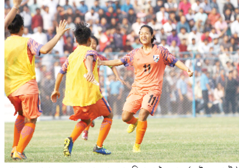
পাঞ্জাল চনবদা মতুং হৰাওবা ফোওদোকখিবা দাংমে গ্ৰেন্স (ফাইল ফোটো)

নু দোল্লি, দিসেম্বৰ ২৮ (এজেন্সী): ইন্দিয়ানী নুপীগী ফুটবোল টিমগী ষ্টিৱিক্টর ওইৱিবা মণিপূৰী মাচা দাংমে গ্ৰেন্সনা ফোওদোকখিবা টিম অদুনা শৰুক য়াখিবা শামরায় খুদিংমক মশা-মশাগী ওইবা পোজিসন্দা ষ্টিৱ গুণ্ডনি হায়খিবগা লেয়ননা মখোয়গা শামমিৱা অসিনা মহাক্কা চাওখোকনিং ওইনি হায়খি। মণিপূৰগী চুৱচামপুৰ দিষ্ট্ৰিক্টকী কাংভাই সব-দিভিজনগী মনুং চৰা লৈবা দিমদাইলোং ভিলেজগী ৰোংমে টাইৱকী সাইমোন দাংমে অমসুং ৱিতান্দাংমীগী মচানুগী দাংমে গ্ৰেন্সনা ইন্টাৰনেশ্বনল কৰিয়ৱ অদু কুম্জা ২০১৩ দা এশিয়ন ফুটবোল কাৰিক্কাৰগী কালিক্কাৰদা শামবা হৌখি। মদুগী মতুংদগী মহাক্কা ইন্দিয়ানী সেনিয়ৱ ৱিমেণ ফুটবোল টিমদ লৈপুনা শামদুনা লাঞ্ছি। দাংমে গ্ৰেন্সনা ওল ইন্দিয়া ফুটবোল ফেডৰেশ্বন (এ আই এফ