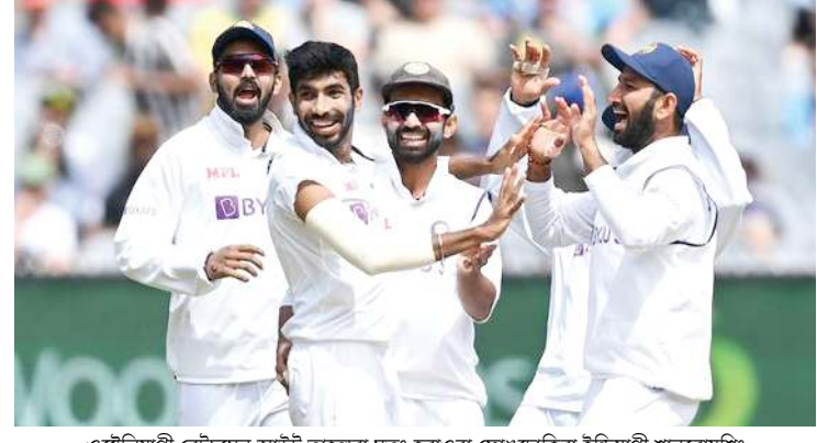
ওষ্ট্ৰেলিয়াগী বেটসমেন আউট তাহল্লা মতুং হৰাওবা ফোওদোকখিবা ইন্দিয়ানী শামরায়শিং

মেলবোর্ন, দিসেম্বৰ ২৮ (এজেন্সী): ইন্দিয়া অমসুং ওষ্ট্ৰেলিয়ানা মেলবোর্ন ক্ৰিকেট গ্ৰাউন্ডদা শামখিবা অনীশুৰা টেণ্ট মেটচকী ওসি মন্তু শুভা নুমিৎকী শামবা ইন্নিংসতা বেটসমেন ৬ আউট ওইৱগা ১৩৩ দা লৈখিবদগী মেটচ অদু ইন্দিয়ানা মায়াপকপা য়াবগী লয়েল নকশিনশ্বে। মেটচ অদুগী গুৱাং নিনিশুৰা নুমিৎকী শামবা লেইখিবদগী ইন্দিয়ানা মায়েকৈদগী ভিৰাট কোহলিগী ম্হংতা কেপ্টেন ওইনা থোইদাং লৌৱিবা অজিনকা ৱহননা আউট ওইৱগা ১০৪ লৌদুনা অমদি ৱবিব্ৰ জেডজানা ৱন ৪০ লৌৱগা লৌদুনা মেটচ অদুগী বেটসমেন ৫ আউট ওইৱগা ৱন ২৭ লৌদুনা লৈখিবা অদুগী মখাথৰকপদা ওসি ইন্দিয়ানী ওইনা মখাথৰা ৱন ৪৯ হাফচিল্লগা ইন্নিংস অদু লেইখিবনি। অজিনকা ৱহনে গুৱাংগী ফোৱা অদুদুগী ৮ হাফচিল্লগা অপুনবা ৱন ১১২ দা আউট ওইৱগা, মহাক্কা পুয়া বোল ২২ ও ময়োক্রুবা ফোৱা ১২ লৌৱমখি। অমরোমদা ৱন ৪০ লৌদুনা ওসি মখাথৰা শামরায়কখিবা ৱবিব্ৰ জেডজানা ৱন ১৭ হাফচিল্লগা অপুনবা ফোৱা ৫৭ আউট ওইখি।