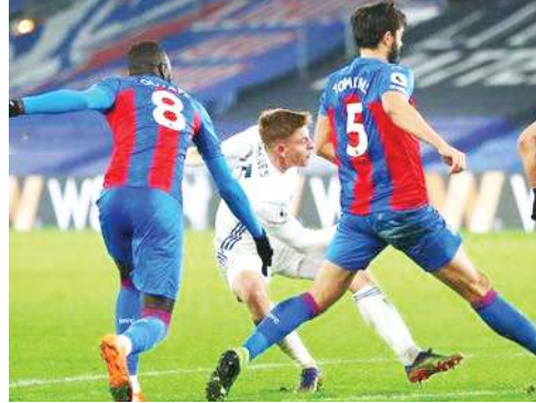
লেষ্টৱ সিটি অমদি খুষ্টল পেলেসকী শামরায়শিং দ্ৰো চংখিবা মেটচতা বোল মূৱবা