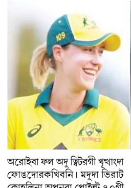
আৱেইবা ফল অদু ষ্টিৱিৰগী খুখাংদা ফোওদোকখিবনি। মদুগী ভিৰাট কোহলি মনা অপুনবা পোইন্ট ৭০ গী মনুংদা ৬৬ ফংলগা মনা অদু ফংখি।

আৱেইবা ফল অদু ষ্টিৱিৰগী খুখাংদা ফোওদোকখিবনি। মদুগী ভিৰাট কোহলি মনা অপুনবা পোইন্ট ৭০ গী মনুংদা ৬৬ ফংলগা মনা অদু ফংখি। নীংথিংবা য়াই, চহী ৩২ শুৱবা ইন্দিয়ানী কেপ্টেন ভিৰাট কোহলি হৌখিবা চহী ১০ অসিগী ৱন দে ইন্টাৰনেশ্বনল ক্ৰিকেট মেটচতা ৱন ১২,০৪০ লৌবা ওমখি। টেট ক্ৰিকেটতা ৱন ৭০১৮ অদুগা টি-২০ মেটচশিংদা ৱন ২২২৮ লৌৱগা পেরিনা টি-২০ ৱৰ্ক কপ মরি লৌবা শৰুক য়াখি অমসুং কুম্জা ২০১৩ গী নুপাগী ৱন দে ইন্টাৰনেশ্বনল ৱৰ্ক কপসু লৌখিবা