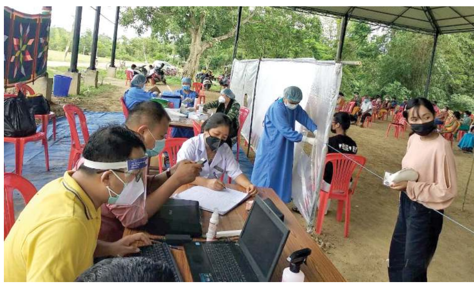
স্টেট অসিদা হৌজিক চখরিবা কোভিড-১৯ ভেজিন কাপ্পা থবক খোজ্জেল য়াঙশিনহম্বা মণিপুর লৈডাক্রা লৌখংলকপা হৌরাংগী মখাদা দিষ্টিক্ট এডমিনিস্ট্রেশন, হৌবালানা শীন্দুনা দিষ্টিক্ট অসিগী তোঙান তোঙানবা মফমশিংদা পাঙথোকখিবা মাস ভেজিনেশন

দিমাপুর, জুন ২৯ (এজেন্সী): নাগালেন্দা হৌখিবা পুং ২৪ গী মনুংদা কোভিড-১৯ গী অনৌবা কেস ৯৪ থেংনখিবা লায়না হায়রিবা মতম অসিদা মীওই ১০৮ লায়না লাইচং অসিদা মীওই অমত শিহনখিবে হায়না স্টেট হেলথ এন্ড ফেমিলি রেলফেয়র দিপার্টমেন্ট মায়টেকেনী ফোণ্ডেশন।