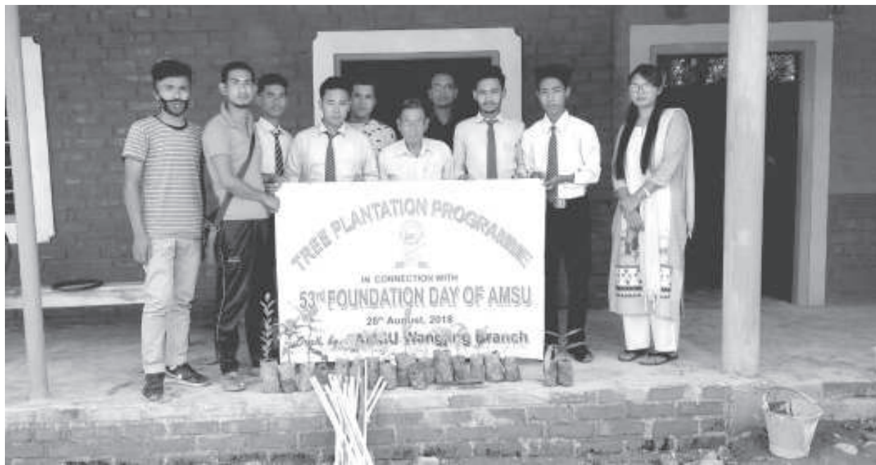
এমসু লিংখংখিবনী ৫০ শুরা কুমওন যৌরমগা মরী লৈননা এমসু ব্রাজিং ব্রাঞ্চনা শীন্দুনা পাঙথোখিবা উ চারশিং থাবনী যৌরম

টোপায়েল/ফিল্ডলাদা মখল অমা হুংলগা নাই চারকপা, অমাঙথোং মনুংদা মতুম অনি পোমথোক্লগা লৈবা, খোঙ হান্না চাং নাইদবা, অমাঙথোং ময়াদসু চাউনা পোমথোক্লগা লৈবা, অহিং ভুয়া যাদবা, হকচাং হৈনিং-শিনিংবা পোক্তবা ফহনবনী ওজা জিয়া উল হকপু থাগৎচরি