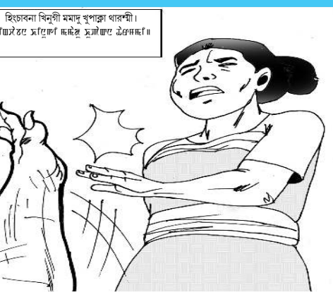
হিচাবনা বিনুগী মমাদু খুপাৰা থাৰশী। কাৰ্জাৰে ম্হুংগা ম্হুংগা ম্হুংগা ম্হুংগা