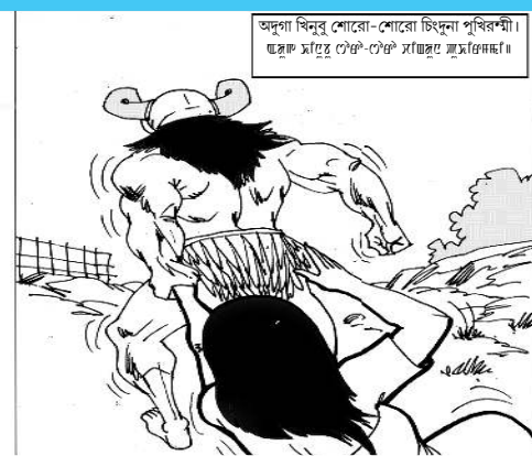
অদুগা বিনুগু শোৱো-শোৱো হিচাবনা পুখিৰশী। হ্ৰুংগা ম্হুংগা ম্হুংগা ম্হুংগা ম্হুংগা