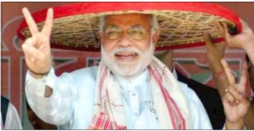
মোদিনা মোৰানৰ মতামত অসামগী টি গাৰ্দেনদা লৈৱাৰা শীম্বাশিংগী অৱাৰা অদু ময়ক শেংনা খঙগনি।

গুৱাহাটী, মাৰ্চ ৩০ (এজেন্সী): লোকসভা মীখল নকশিল্পকপগা লোয়ননা লৈবাক শীনবা থুনা তেঙানবা-তেঙানবা পাৰ্টিশিং অমসুং লৈবাক পায়ৰিবা বিজেপিগী ভোট খোহুগী থবক মৈ হৌগৎলক্ৰি।